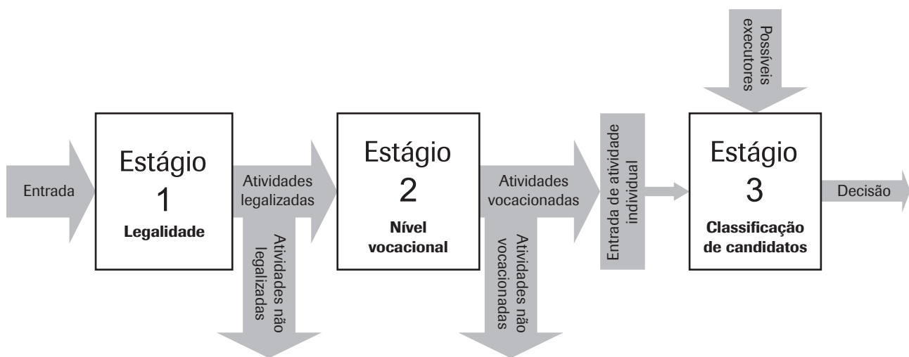
Figura 1: Modelo Proposto - Diagrama em Blocos.

Estágio 3: Neste estágio, através de um segundo processo decisório multicritério, também pela metodologia SMARTS, pode-se ter finalmente a indicação de se a terceirização é a estratégia de produção indicada para uma dada atividade, ou não. O fundamento deste estágio está baseado no fato de que não se pode avaliar o desempenho de uma atividade sem avaliar o executor ou candidato a executor da mesma. Assim, as atividades produtivas até o estágio 2 foram tratadas como alternativas ao problema de decisão colocado, entretanto neste estágio elas deixam de ser alternativas e passam a ser o próprio objeto de estudo do problema. Aqui, cada atividade é submetida individualmente, as alternativas agora são os candidatos a executores da atividade em análise. A elicitação dos valores para cada um dos candidatos a executor nos atributos definidos exigirá a obtenção de muita informação fora da organização. Por ser esta uma tarefa demorada e crítica é que, no estágio anterior, recomenda-se restringir